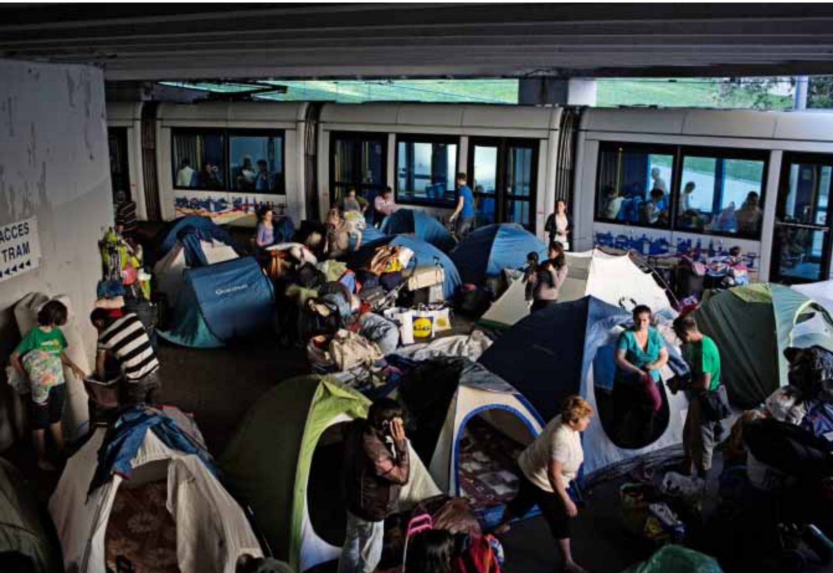
Albanese en Kosovaarse families leven en slapen bij de ingang van station Place Carnot in Lyon, Frankrijk

Socioloog Saskia Sassen over brutaliteit en extremiteit in de wereldeconomie